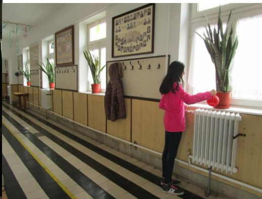
Minden osztályban és folyosón van virág