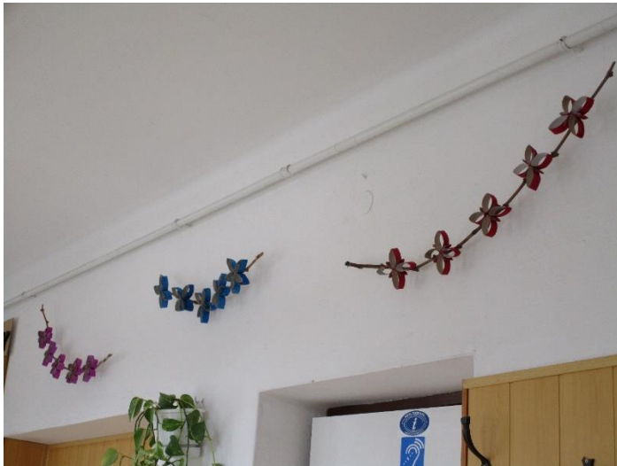
Díszek természetes anyagokból a Perczel utcai épület folyosóján