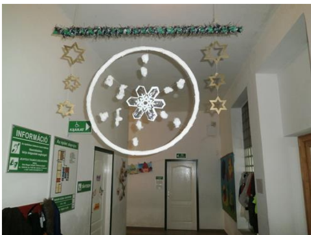
Folyosói látkép Hősök tere épületben